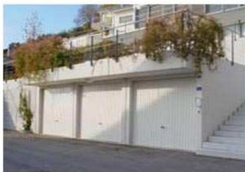
Garages semi-enterrés avec porte basculante, avant-toit et terrasse végétalisée