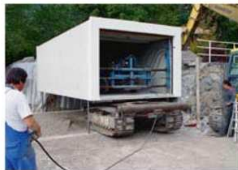
Mise en place du garage avec le véhicule à chenilles de l'entreprise, spécialement conçu pour des espaces restreints

Les prestations suivantes sont comprises :