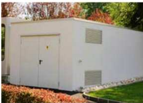
Cabine pour transformateur

En dehors des avant-toits, fenêtres, portes ou toits spéciaux, nous réalisons également pour vous des garages de grandes dimensions ou destinés à de multiples usages. Par exemple, nous fabriquons des garages avec des hauteurs de porte jusqu'à 3,12 m permettant le stationnement de véhicules utilitaires ou de mobile-homes. Nous fabriquons aussi des ouvrages servant d'ateliers ou d'entrepôts ainsi que des objets en forme de transformateurs ou de centres de collecte communaux.