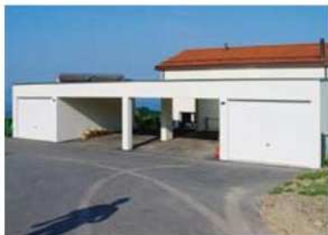
Solution de garages avec abri pour voitures