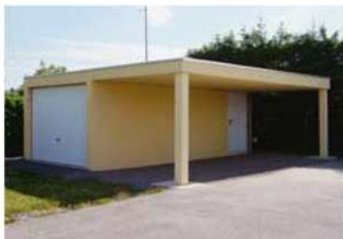
Garage avec porte basculante, porte de service, abri/avant-toit en béton

Du simple garage individuel aux modèles avec abri, fenêtres, portes, etc., nous répondons à vos souhaits de confort et d'esthétique.