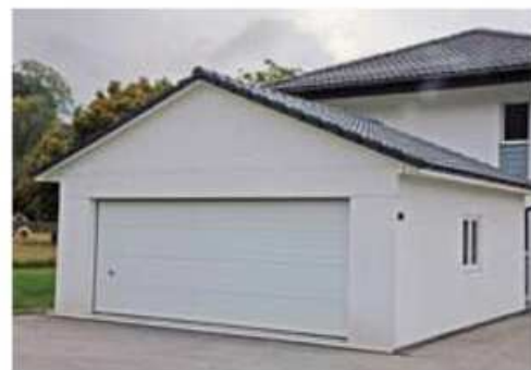
Garage attenant à deux pans et fenêtre

Les garages de CREABETON offrent au maître d'oeuvre et à l'architecte une grande liberté d'aménagement. Qu'il s'agisse d'une exécution à toit plat ou à deux pans ou d'un tout autre style de construction, nous respectons vos souhaits spécifiques.