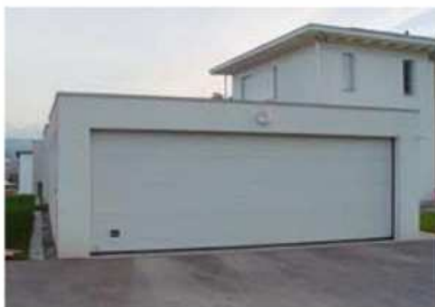
Garage double avec porte sectionnelle

Les garages de CREABETON à grande porte disposent d'un espace intérieur sans cloison. L'assortiment propose des garages jusqu'à une largeur de porte de 5,50 m.